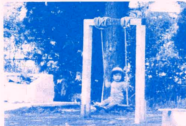
手づくりのブランコ ゆらゆら～♪