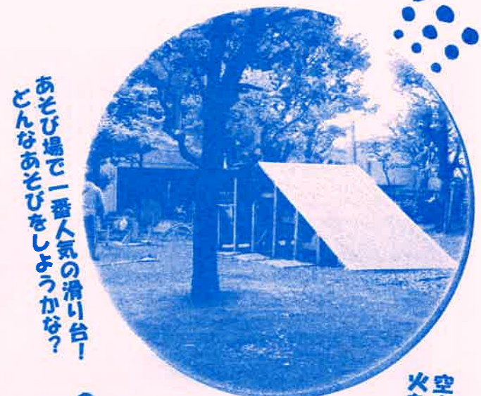
あそび場は「あそび場」の準備中