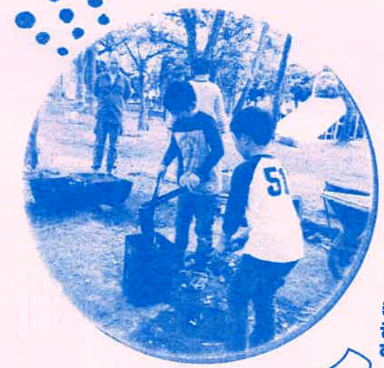
空き缶を熱くしてあそび場になるかな? 火を使う遊びもすくすくしてみよう! できます。

プレーリーダーは子どもの目線に立ち一緒に遊んだり、相談にのったり、子どもが自分で工夫して遊ぶのを見守っています。遊具の点検、けがへの対応など、大人の役割をします。プレーリーダーは『11:00~夕焼けチャイムまで』(土日は10:00~) 火、水を除く週5日 皆さんを待っています!