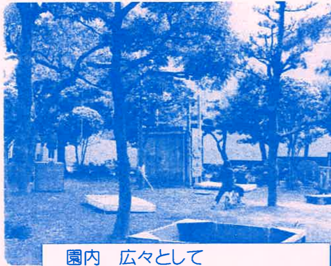
園内 広々として 木登りできる木もあります♡